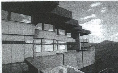
Von vielen ungeliebt: Das Betonrestaurant aus den 70er Jahren auf dem Drachenfelsplateau wird abgerissen.

Grund für die Explosion um 400 000 Euro (280 000 Euro trägt das Land über Städtebauförderungsmittel, 120 000 Euro muss die Stadt in ihrem Haushalt 2011 zusätzlich einplanen) sind laut Andreas Pätz zum einen Mehrkosten für die Inneneinrichtung (unter anderem Küche). Zum anderen habe eine Neuberechnung die so genannten rentierlichen (nicht