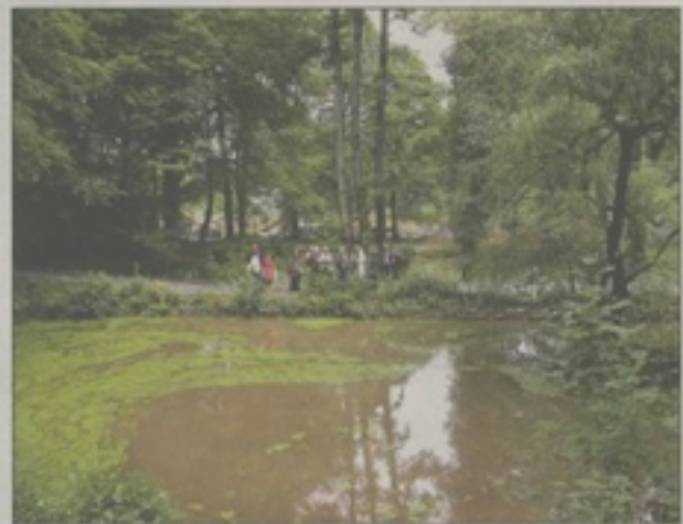
Bald fertig: Noch hat der Bagger zu tun (ganz oben), die Teiche präsentieren sich indes schon in voller Pracht (unten rechts). Die Regionale-Vertreter (unten links) sind zufrieden.

alisiert; die Grundmauern werden durch Grabungsfenster zu sehen sein. Ein Rundweg lädt zu Spaziergängen durch die Natur ein: An drei Teichen kann dort verweilt werden, wo die Zisterzienser früher Fisch fingen. Stücke des Heisterbachs und des Keltersiefen wurden renaturiert. Ein Wasserspiel wird noch entstehen. Besucher können an einem zentralen