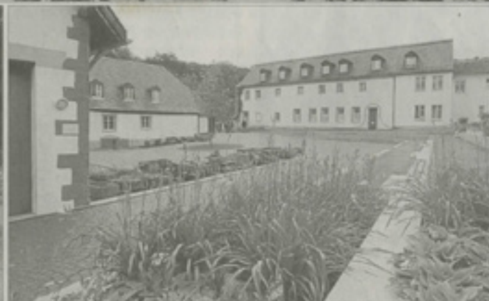
Wo Geschichte erlebbar wird: Die schon von den Mönchen angelegten Teiche (oben) und die Chorrüine (u.l.) zeugen von den Zisterziensern. Der Wirtschaftshof des einstigen Klosters wurde ebenfalls neu gestaltet.

„Sehr spannend“, so Wiehlpütz, sei die Arbeit an den Teichen gewesen, in denen die Zisterziensermönche einst Fische züchteten. Fachleute sorgten dafür, dass der Heisterbach nicht mehr an irgendwelchen Stellen durch die Klostermauern fließt und die